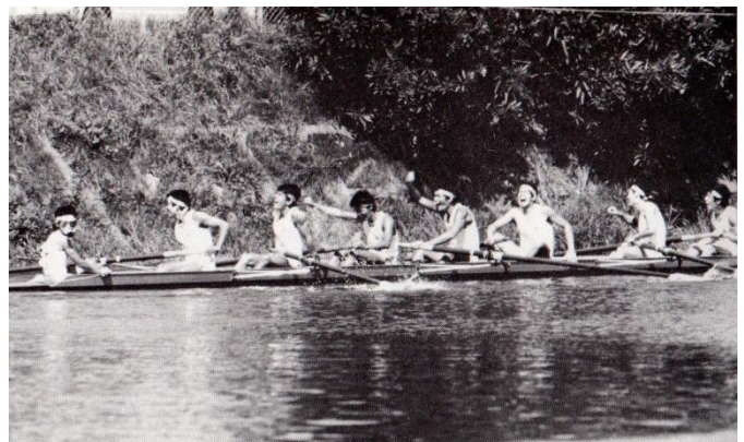
右：全日本選手権 4 連覇ゴール直後